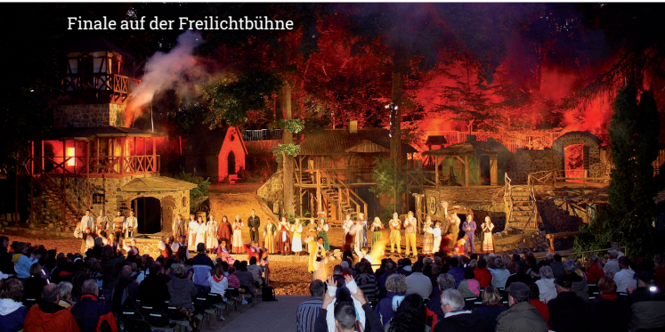
Finale auf der Freilichtbühne

Mit der urigen KulturSchänke ist im Jahr 2021 ein überdachter Veranstaltungsort hinzugekommen, der auch bei schlechtem Wetter 150 Gästen Platz bietet. Schauen Sie doch mal vorbei, wir freuen uns auf Sie.