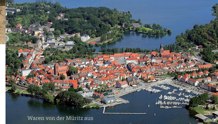
Waren von der Müritz aus