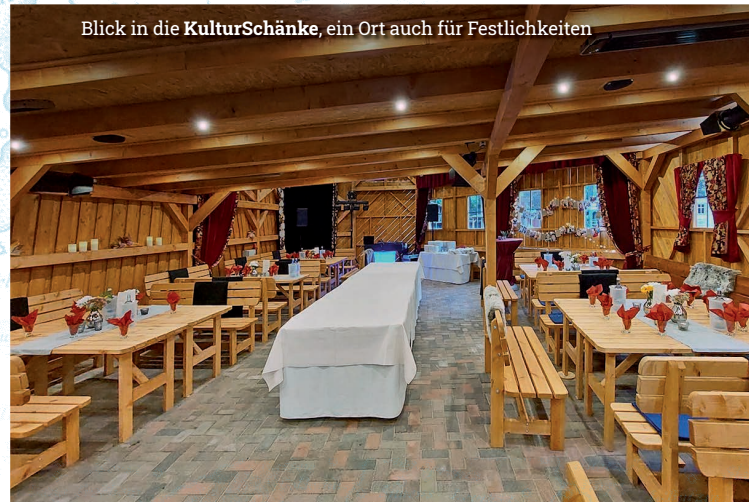
Blick in die KulturSchänke, ein Ort auch für Festlichkeiten

Tauchen Sie mit uns ein, in eine Geschichte voller Spannung und Humor. Lassen Sie sich von phantasievollen Bühnenbildern, historischen Kostümen, aufregenden Gefechten, Reiterei und Musik auf eine Reise in die Vergangenheit der Müritz-Region entführen.