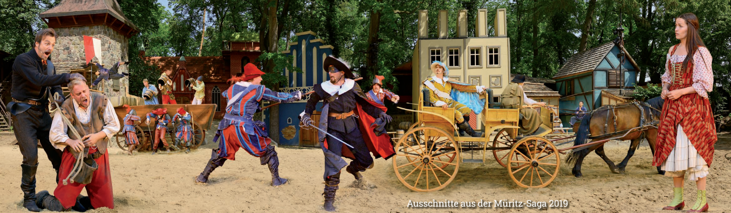
Ausschnitte aus der Müritz-Saga 2019