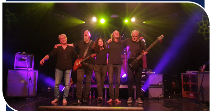
Auch dabei: "Frollein Motte".

Jetzt wird endlich wieder gerockt. Am Samstag, 2. September 2023, findet das reguläre PladeLu-Festival (zuvor bekannt als Polizei Rockfestival) im legendären Columbia Theater Berlin statt. Einlass ist um 17.30 Uhr. Ab 18.30 Uhr stehen vier erstklassige Rock-Bands sowie ein abwechslungsreiches Pausenangebot mit einer Feuer- und Licht-Show auf dem Programm. Das Versprechen der Veranstalter für einen unvergesslichen Konzertabend lautet: jede Menge Spaß, mitreißende Livemusik, geselliges Beisammensein im Biergarten bei Speisen und Getränken, ein tolles Ambiente und super Stimmung.