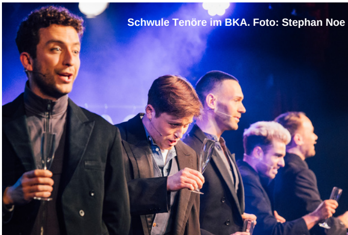
Schwule Tenöre im BKA.

Mit dieser Produktion feiert das BKA die Wiedergeburt der „Berliner Operette“, ein Genre, das in den 1920ern Rollenbilder strapazierte, Diversität zelebrierte und so das Bild von Berlin in der Welt mitprägte. Hundert Jahre später führt die „Operette für zwei schwule Tenöre“ diese Tradition fort.