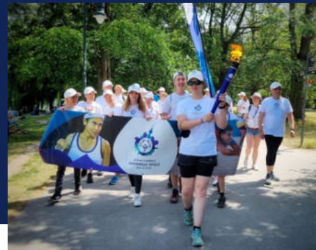
Impression aus 2022.

Die Auswahl der LäuferInnen erfolgt nach Eingang der Meldung: wenn voll, dann voll.