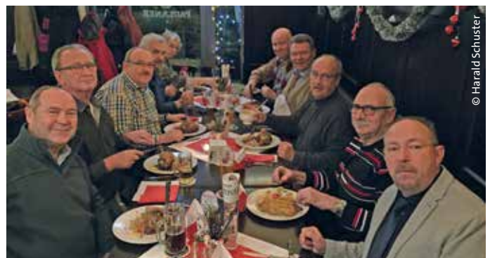
> Die Fragestunde wurde zur Gesprächsrunde im nahegelegenen Restaurant.