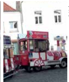
> Eindrücke von der Fahrt nach Waren