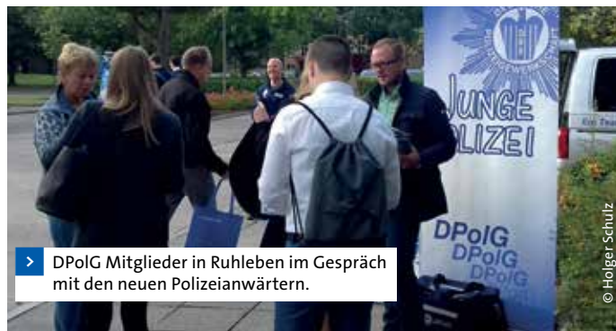
> DPoIG Mitglieder in Ruhleben im Gespräch mit den neuen Polizeianwärtern.