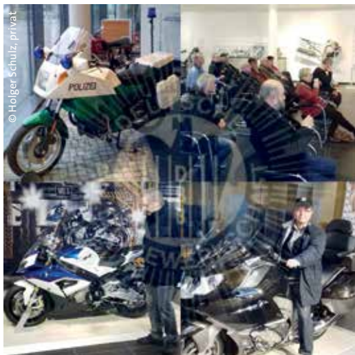
Senioren lauschen einem Vortrag und Motorräder von 1928 bis 2016 in der Schau